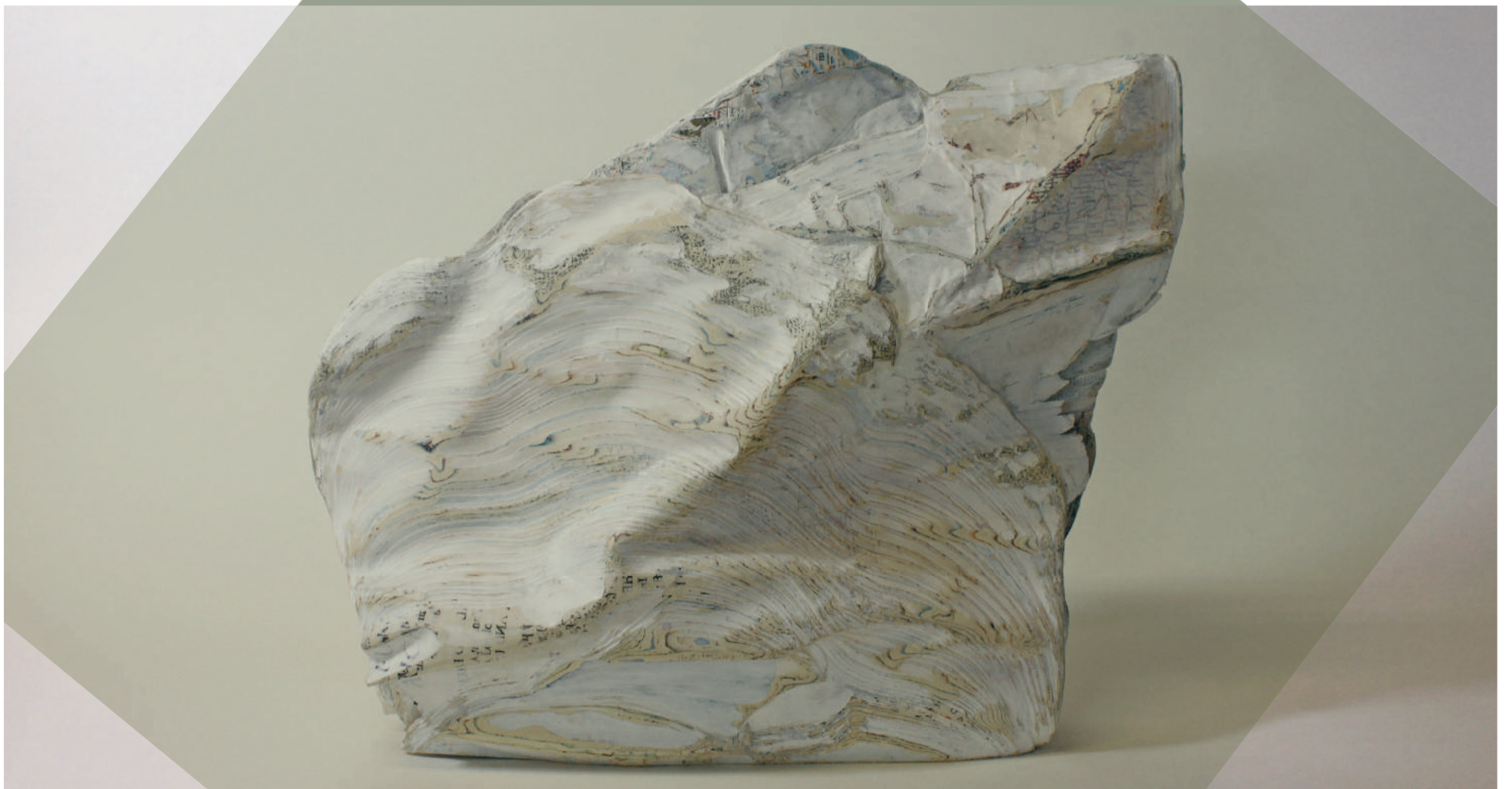
detail werk Brigitte Picavet